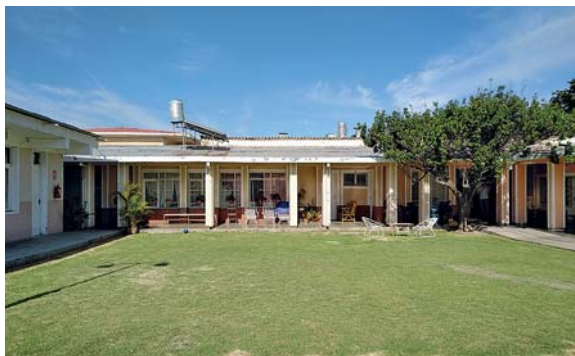
Casa Sueca där evangeliska kyrkan hyr ut kontor åt olika funktionshinderorganisationer är en trevlig samlingsplats.