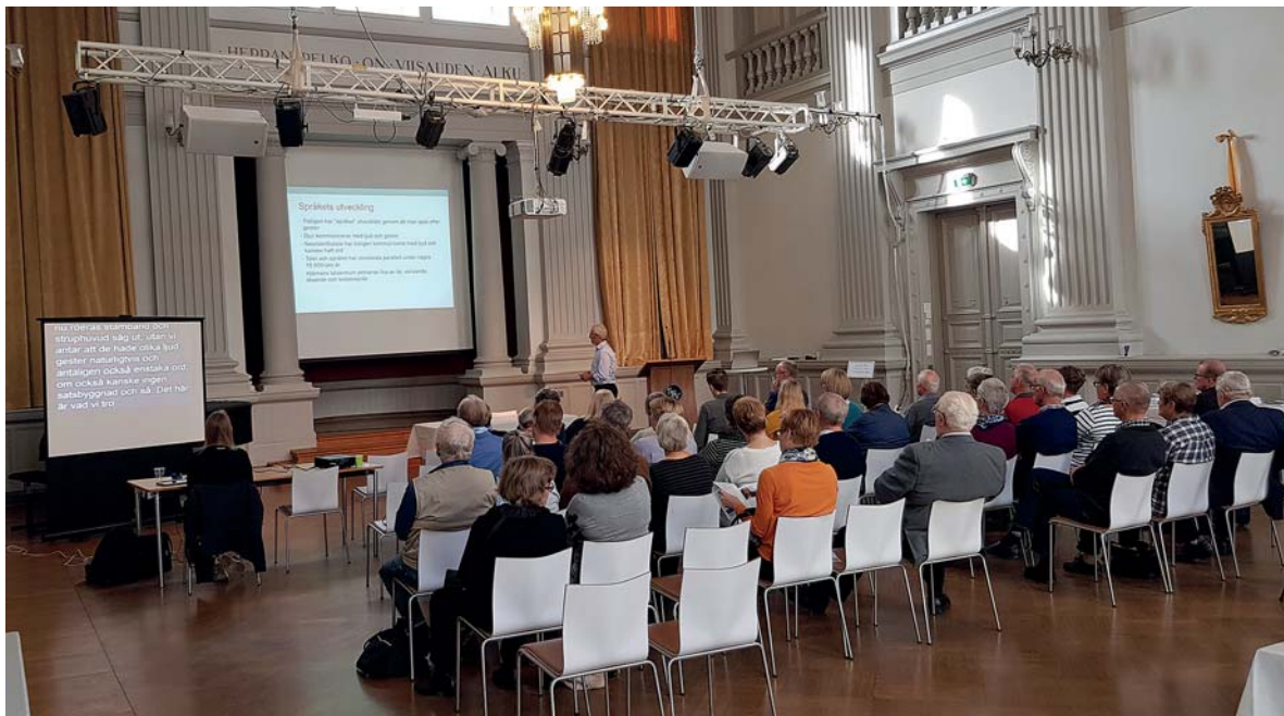
Förbundets hörselseminarium hösten 2018.