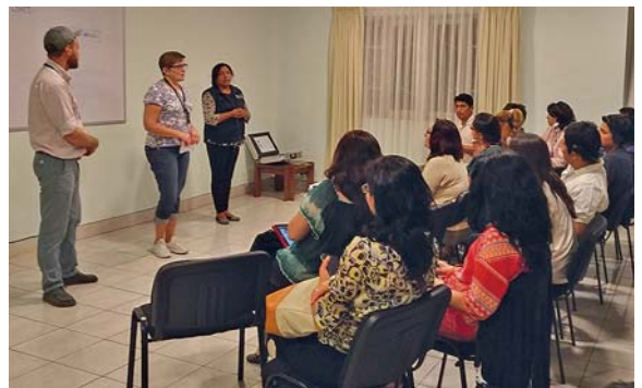
De bolivianska organisationerna hoppas kunna skapa ett eget första hörsselförbund i Bolivia. Titi håller föredrag om förbund och föreningars funktioner utifrån Svenska hörsselförbundet rf:s historia och struktur.