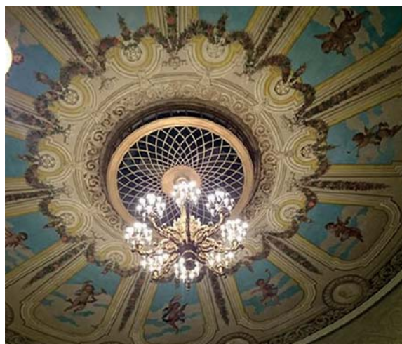
Den som lyfter blicken mot Svenska Teaterns inbertak, belönas med denna vackra syn.

Dagen arrangerades av TRIO-gruppen, Svenska hörsel förbundet rf, Svenska pensionärsförbundet rf och Förbundet Finlands Svenska Synskadade rf.