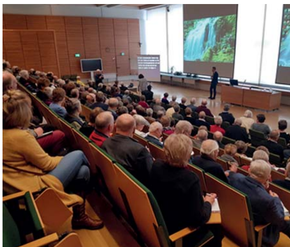
Seminarium kring hörsel och syn lockade en stor publik i Åbo.