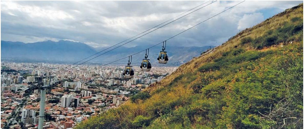
Cochabamba sett från vägen upp för berget San Pedro.