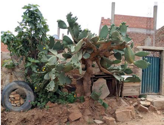
Fikonkaktusen växer mest överallt.