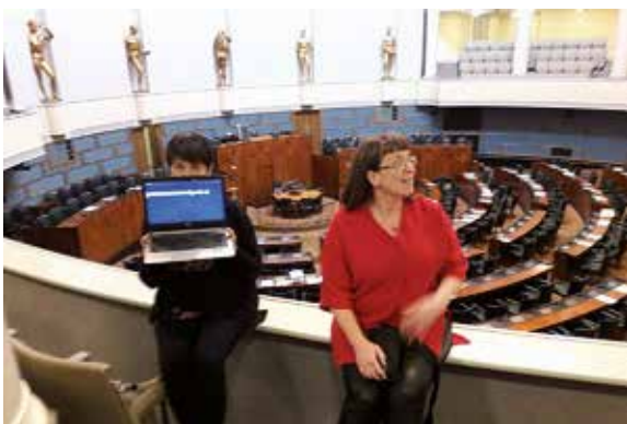
Två skrivtolkar deltog under rundvandringen och informationen som gavs kunde läsas på datorskärmen.