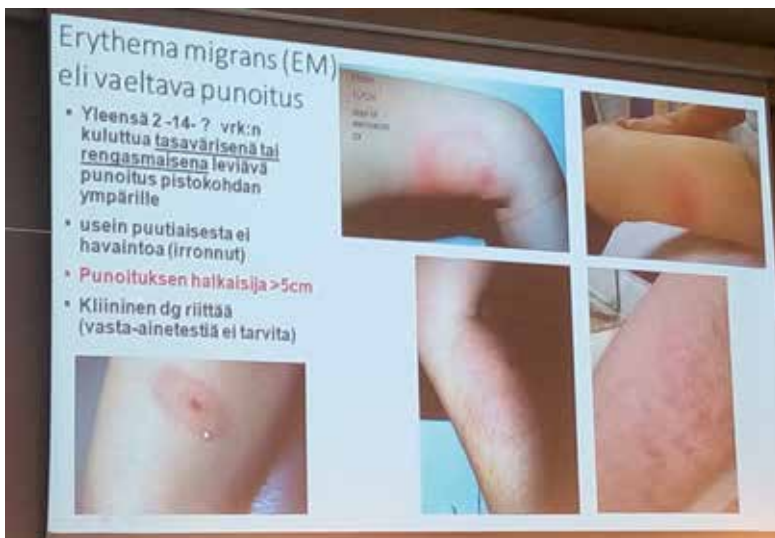
Bett av fästing kan se olika ut.

Antalet fästingar har under de senaste åren ökat i skärgården och vid kusten. Samtidigt har fästinggränsen förflyttats allt längre norrut. Fästingar kan överföra ett flertal sjukdomar till människan. De vanligaste i Finland och Sverige är Borrelia, eller Borrelios och TBE – fästingburen hjärninflammation eller hjärnhinneinflammation.