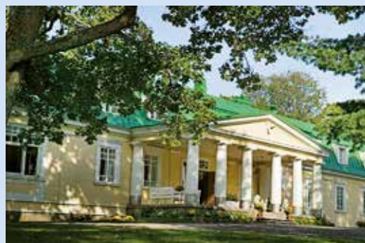
Kaisankoti i Esbo