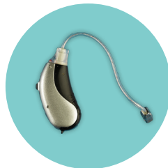
Tunntråd med högtalare (RIC)