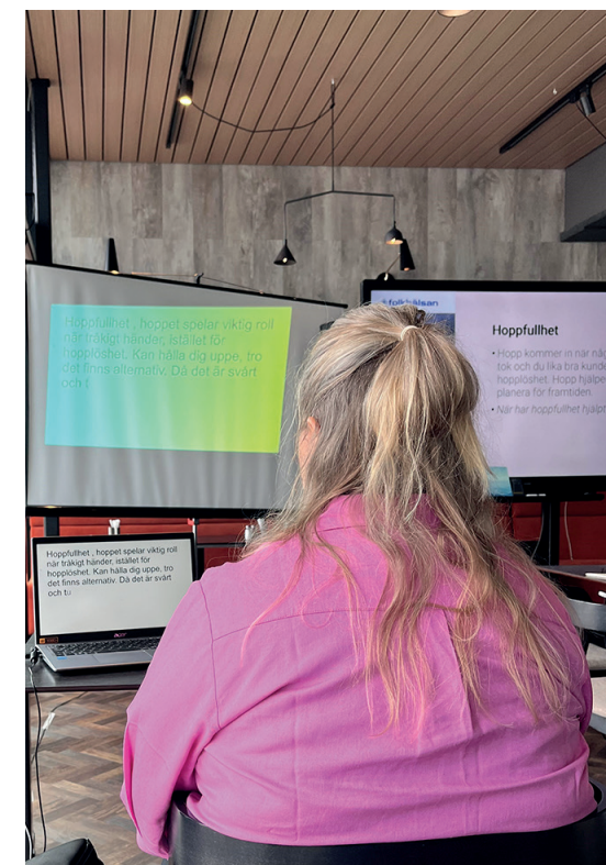
Skrivtolkningsuppgifterna spänner över föreläsningar, arbetsmöten, bussresor och seminarier.

– Allt kan falla på kommunikation. Med hörselnedsättning blir det som trasiga