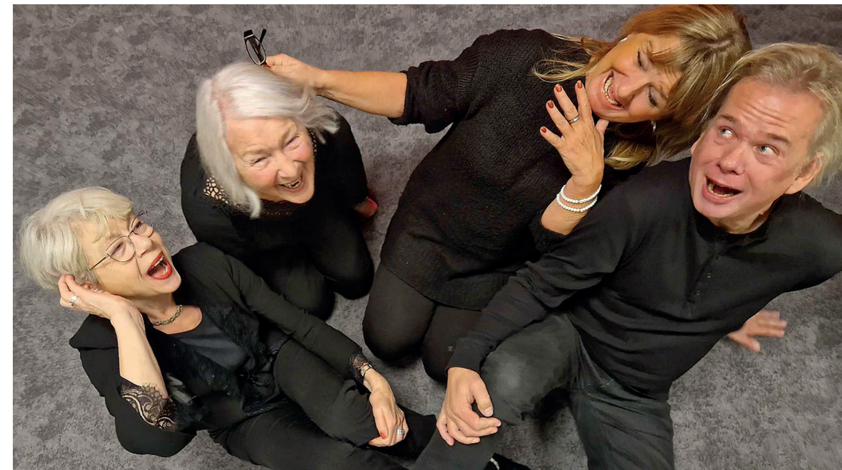
När medlemmarna samlas blir allt roligare, även repetitionerna.

– Efter varje föreställning delar medlemmarna sina egna hörselresor. Nästan alltid säger någon: 'Hipp-Happ räddade mig'.